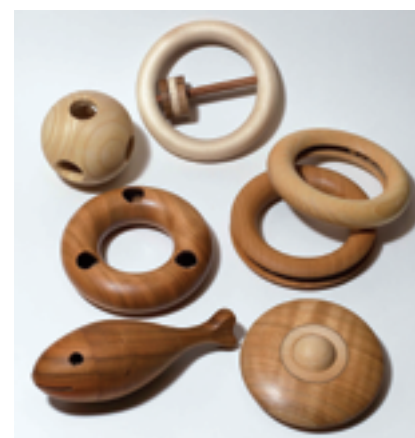
Heute noch verfügbare Greiflinge Allbedeut

sprünglichen Idee spüren, die hinter ihrer Entwicklung steht. Und diese Idee sollte man zum Anlass nehmen, einmal über das aktuelle Angebot an Greif- und Lernspielzeugen nachzudenken, sowohl in pädagogischer Hinsicht, als auch im Hinblick auf die aktuelle Diskussion über die Gefahren von Giften, die von Kunststoffen und Lacken gerade für Kleinkinder ausgehen können.